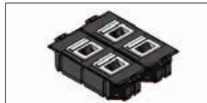
Anzahl Tragbügelgeräte: 4 Stück