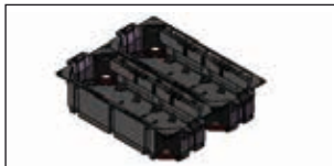
Bestückung Gerätebecher: 2 x Gerätebecher GTVR300, GBVR300, GTVD200