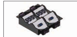
Daten- und Medientechnik: individuell bestückbar