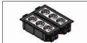
Anzahl Rastec 45° Geräte: 6 Stück